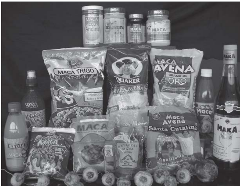
Gama de productos de maca disponibles en Perú, 2002.

The transition of maca from neglect to market prominence: Lessons for improving use strategies and market chains of minor crops. Michael Hermann & Thomas Bernet. Agricultural Biodiversity and Livelihoods Discussion Papers 1. Bioversity International, 2009, 101 p. www.bioversityinternational.org/publications/publications/publication/publication/the_transition_of_maca_from_neglect_to_market_prominencenbsplessons_for_improving_use_strategies.html