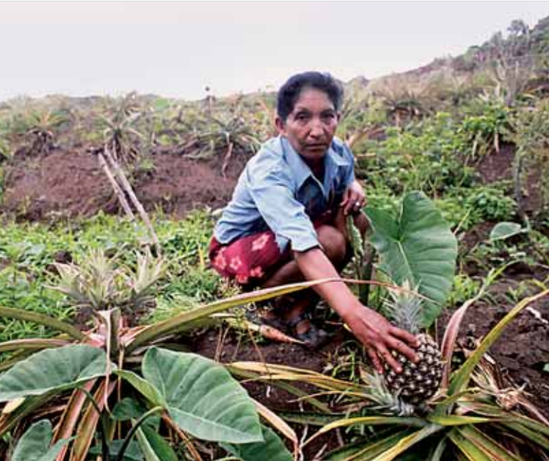
Si les femmes ont droit à la propriété de la terre, elles peuvent alors produire et garantir ainsi leur alimentation et celle de leur famille. Femme de Nueva Segovia, Nicaragua.

La revue Guacal au Nicaragua a consacré l'un de ses récents numéros aux femmes qui demandent l'accès à la terre. En octobre 2008, une manifestation, notamment soutenue par la Plateforme des femmes pour la sécurité et la souveraineté alimentaire et nutritionnelle, a revendiqué la propriété de la terre pour les femmes. Selon une représentante, « ... à l'heure d'un crédit, la femme ne peut en bénéficier car elle n'est pas propriétaire de sa terre ». Un projet législatif en cours d'élaboration, la « Loi créatrice du fonds pour l'achat de terres selon l'équité de genre », a subi de vives critiques; la Plateforme espère que les corrections apportées à ce projet ne perdront pas de vue la remise des titres de la terre