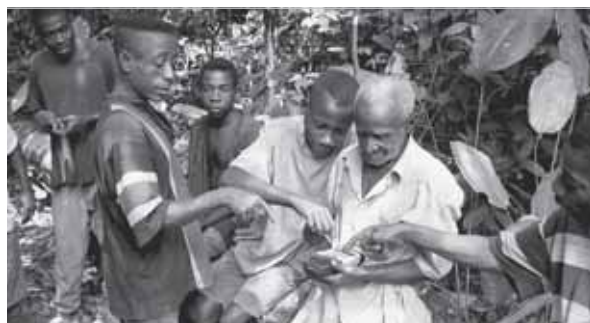
Un jeune homme Pygmée Mbendjele explique à un homme plus âgé comment la communauté peut cartographier ses activités forestières à l'aide d'un logiciel basé sur la technologie GPS.

Free, Prior and Informed Consent and Sustainable Forest Management in the Congo Basin: A Feasibility Study conducted in the Democratic Republic of Congo, Republic of Congo and Gabon regarding the Operationalisation of FSC Principles 2 and 3 in the Congo Basin. Jerome Lewis, Luke Freeman and Sophie Borreill; coord. by Intercooperation and Society for Threatened Peoples. Berne: SECO, 2008. 64 p. www.intercooperation.ch/offers/news/newpublicationcongo , www.tropicalforests.ch/new_publications.php