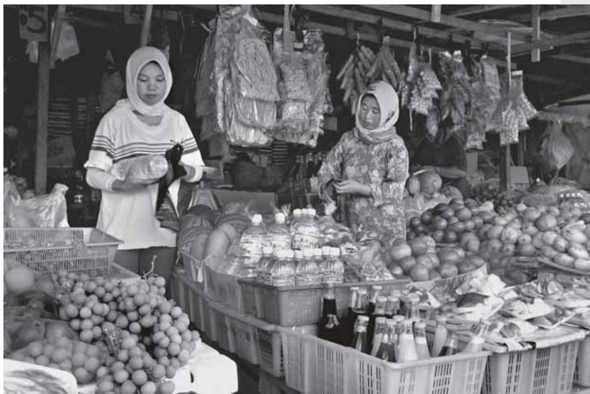
Des fruits frais traditionnels (longan, goyave, pulasan, bambangan), jus de fruits (lime, tamarind) et aliments conditionnés (tapioca, yams) de Bornéo et Malaisie sont potentiellement intéressants pour le marché européen.

Understanding the Revision Process of the Regulation on Novel Foods. Eduardo Escobedo. Biodiversity and Climate Change Section, United Nations Conference on Trade and Development (UNCTAD). 2008. 6 p. www.underutilized-species.org/Documents/PUBLICATIONS/nfr_update_sep_2008.pdf