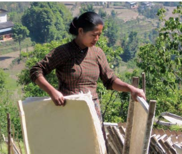
Una mujer empleada en la unidad de transformación de papel Bhimeshwor, Distrito de Dolakha, Nepal. Secado de papel bruto sacado de la fibra Lokta ( Daphne spp ) por los grupos de usuarios locales de los bosques comunitarios. La empresa esta apoyada por el Nepal Swiss Community Forestry Project. (Foto: Jane Carter, Intercooperation (IC-HO), abril, 2008)

La Guía para la Obtención Sostenible de Madera y Productos de Papel tiene como destinatarios principales a las empresas y compradores de papel, madera y productos de madera que carecen de personal con los conocimientos necesarios. La información que proporciona la guía está organizada en torno de los aspectos jurídicos, ambientales y sociales de diez cuestiones clave sobre la producción sostenible. Además de la legalidad de la producción y del problema del cambio climático, la guía plantea dos puntos particularmente interesantes acerca del uso apropiado de fibras recicla-