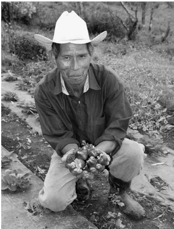
Producción orgánica de fresas en Nicaragua.

Propuesta política para el fomento de la agricultura orgánica en Nicaragua. Borrador propuesto para discusión de parte del sector orgánico nicaragüense. Managua, Febrero 2008. 28 p. www.simas.org.ni/files/cidoc/PropuestaPoliticaOrganica-Nic.080218.pdf