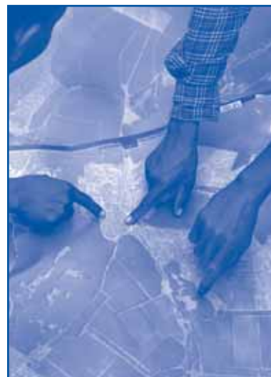
Des Ogiek (Kenya) cartographient leurs territoires ancestraux sur une photographie aérienne agrandie. Le 'Ogiek Peoples Ancestral Territories Atlas' réalisé à l'aide d'un SIG veut aider cette communauté à faire valoir ses prétentions territoriales.

InfoResources Focus paraît trois fois par an en anglais, français et espagnol. Il est gratuit et peut être commandé en format pdf ou imprimé à l'adresse ci-dessous.