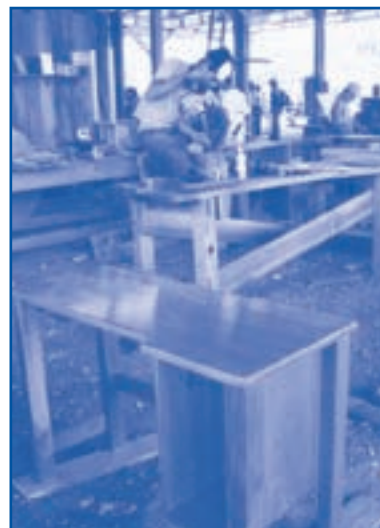
Unidad de transformación para muebles y parquet con la madera que sobra de las exportaciones. Ejidos forestales de la Reserva Maya, El Petén, Guatemala.

InfoResources Focus se publica tres veces al año en inglés, francés y español; es de distribución gratuita y puede ser solicitada en formato PDF o en versión impresa dirigiéndose a la dirección que aparece al pie de página.